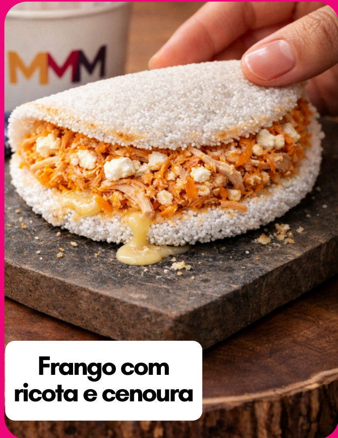
Frango com ricota e cenoura