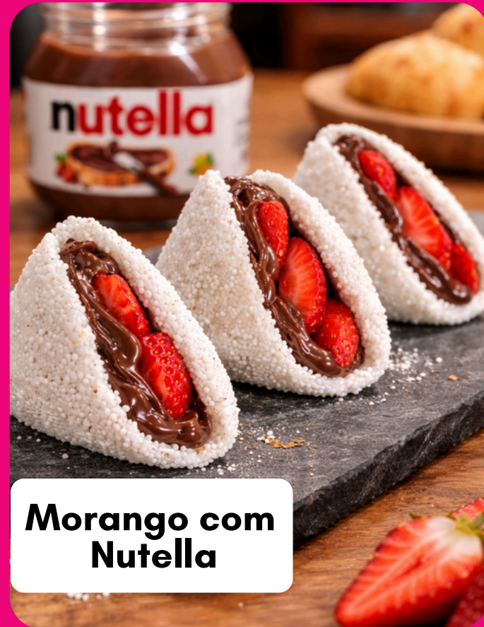
Morango com Nutella