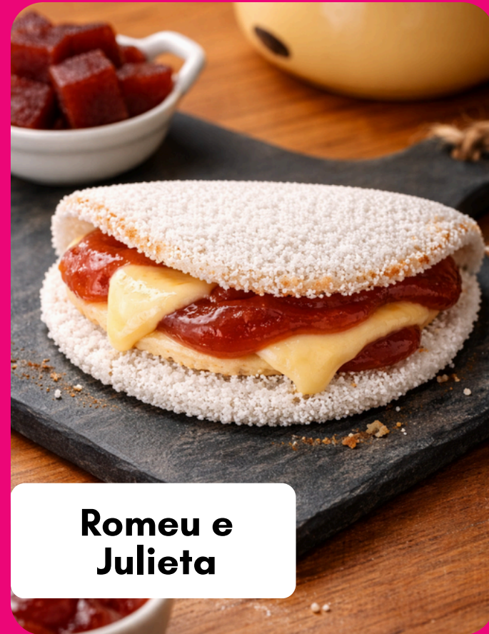
Romeu e Julieta