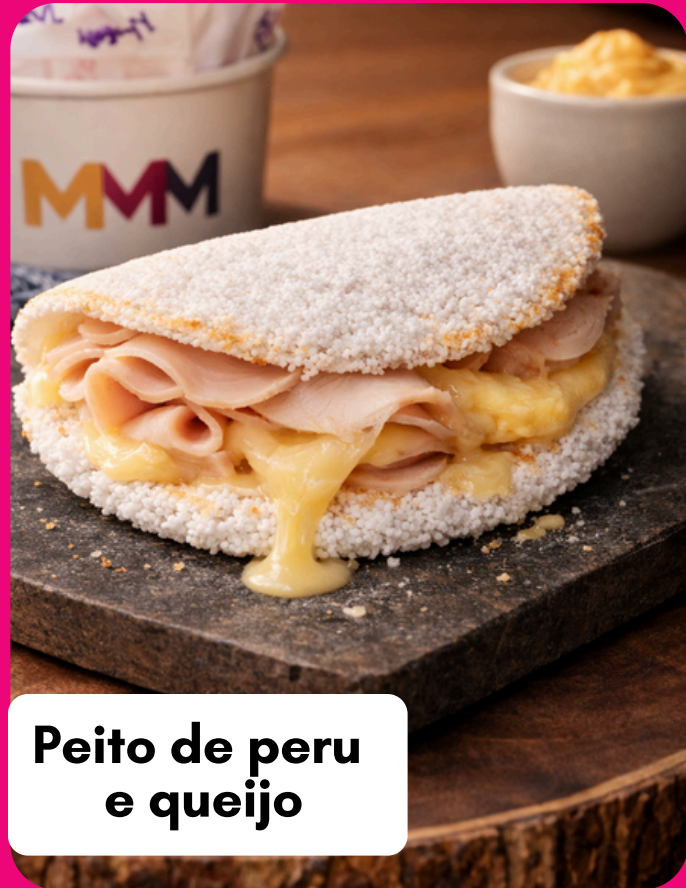
Peito de peru e queijo