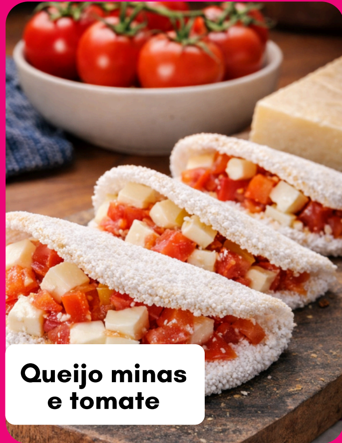
Queijo minas e tomate