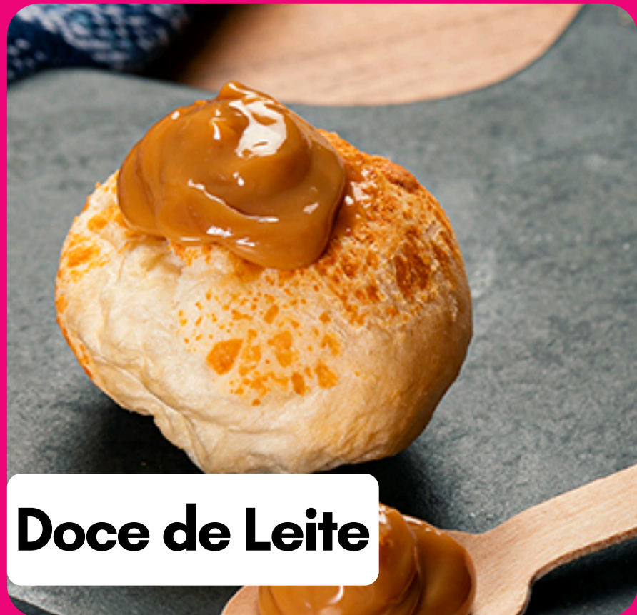
Doce de Leite